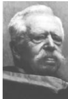
Foto 1: Jakob von Uexküll

A definição do objeto por Uexküll antecipa a definição de “sistema aberto”, que, ao contrário de um sistema fechado, interage com seu ambiente. Visto que cada processo de observação implica em interações entre o observador e o sistema observado, sistemas fechados geralmente não podem ser observados. Assim nenhuma afirmação definitiva pode ser feita sobre eles, nem mesmo se existem ou não (Weizsäcker, 1974). Portanto, é impossível examinar objetos isolados de seu ambiente; em cada caso pode-se observar tão-só interações entre sujeitos (incluindo sujeitos observadores) e objetos.